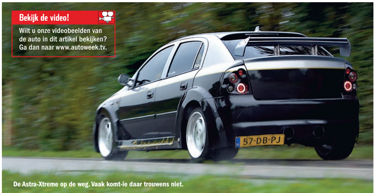
De Astra-Xtreme op de weg. Vaak komt-ie daar trouwens niet.

Wilt u onze videobeelden van de auto in dit artikel bekijken? Ga dan naar www.autoweek.tv .