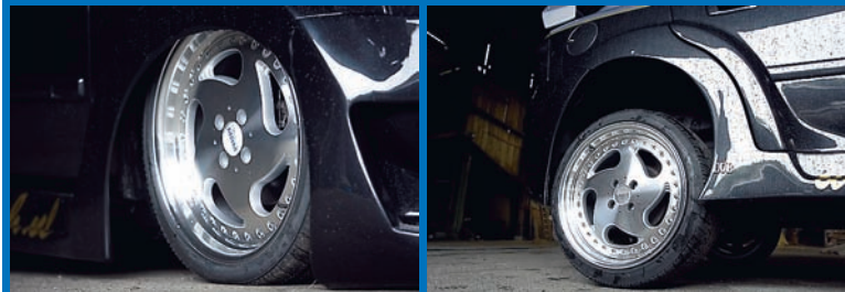
De Astra kan niet alleen omlaag en omhoog, hij kan nog dansen ook!