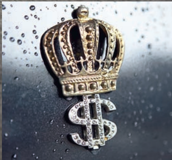
Goud en blingbling wat de klok slaat.