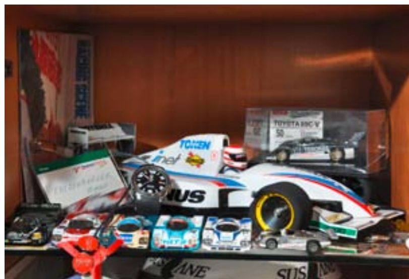
In zijn werkkamer bewaart Rudolf deze verzameling modelauto's van zijn zoon