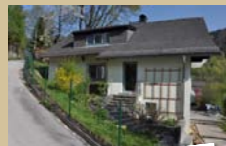
De ouderlijke woning van Roland. De steile weg ernaast was een 'racebaan' voor de kleine Roland op zijn fietsje