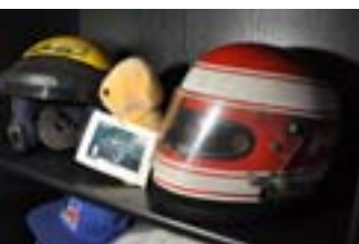
Helmen uit de kart- en toerwagentijd. Mooi!