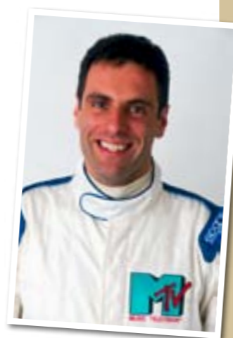
Roland Ratzenberger in 1994, 33 jaar oud en debutant in de Formule 1

Die droom begon op 4 juli 1960 in Salzburg. Roland was het eerste kind van Rudolf en Margit, later kreeg hij nog twee zussen.