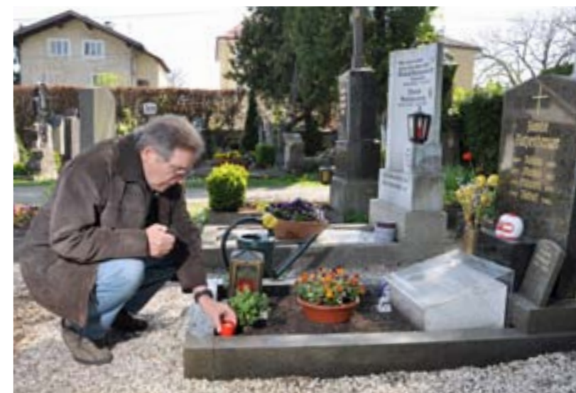
Het graf van Roland Ratzenberger in Salzburg