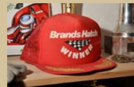
De winnaarschap van Brands Hatch