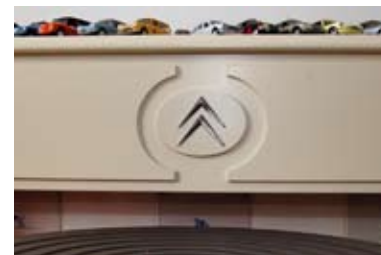
Een bijzonder detail in de schouw van huize Dokter.