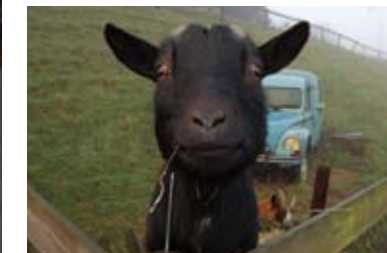
Al eens zo'n gelukkige geit gezien? Op de achtergrond de Acadyane annex geitenhok.