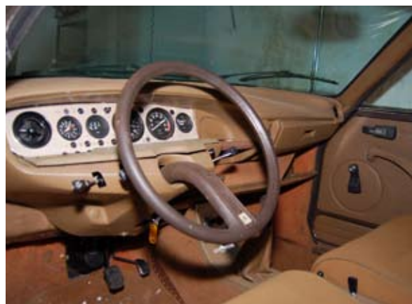
Een - zelfs voor een GS - bijzonder interieur in de Birotor.

En huishouden waar de ramen gedecoreerd zijn met een grote collectie Citroën-modellen, waar schilderijen van de eigen Citroëns de muren sieren, waar de double chevron verwerkt zit in de schouw, waar een splinternieuwe C4 Picasso en een appelgroene GS Break voor de deur staan, waar in de schuren onder het huis nog een 2CV, een Ami Super en een zeer zeldzame GS Birotor huizen en waar in het weiland een Acadyane staat die dienstdoet als onderkomen voor de geiten. Dat geitenhok is een verhaal apart. Ruben en Celeste konden bij hun woning een extra stukje grond kopen, maar omdat het op een dijk lag, bleek het nogal lastig om het weilandje te maaien. Dus kwamen er geiten, maar ook een geitenhok bouwen bleek niet eenvoudig. Creatief én Citrofiel als hij is, wist Ruben de oplossing. "Een Acadyane". lacht hij. "Die hufjes blijven vaak goed, dus